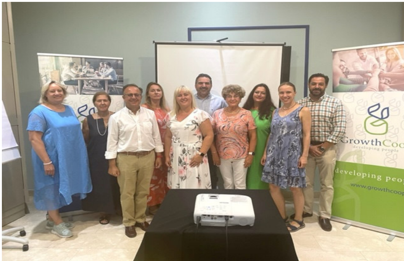
Οι εταίροι του έργου στη συνάντηση της Γρανάδας

Αριθμός έργου 2021-1-LT01-KA220-ADU-000035360